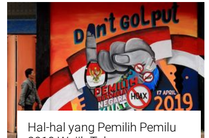
Hal-hal yang Pemilih Pemilu 2019 Wajib Tahu