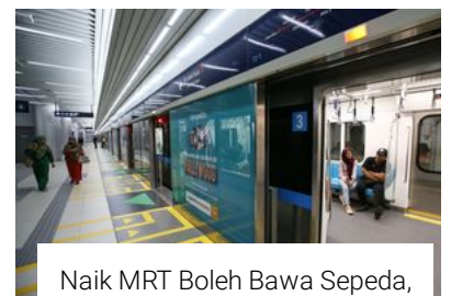
Naik MRT Boleh Bawa Sepeda, Ini Ketentuannya...