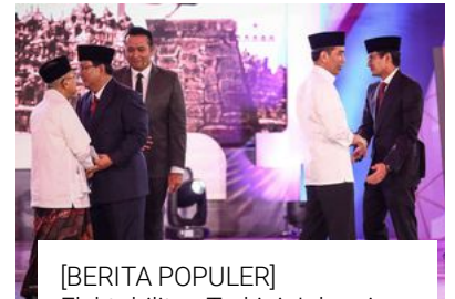
[BERITA POPULER] Elektabilitas Terkini Jokowi-Ma'ruf dan Prabowo-Sandiaga Versi 7 Lembaga Survei