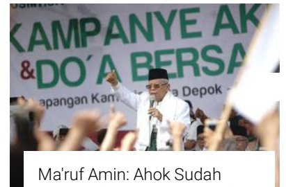
Ma'ruf Amin: Ahok Sudah Kena Hukuman, Masa Jadi Wakil Presiden