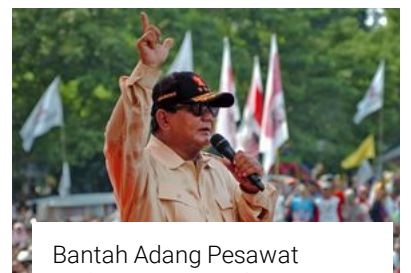
Bantah Adang Pesawat Prabowo, Ini Penjelasan TNI AU