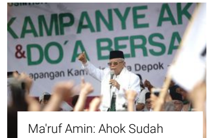
Ma'ruf Amin: Ahok Sudah Kena Hukuman, Masa Jadi Wakil Presiden