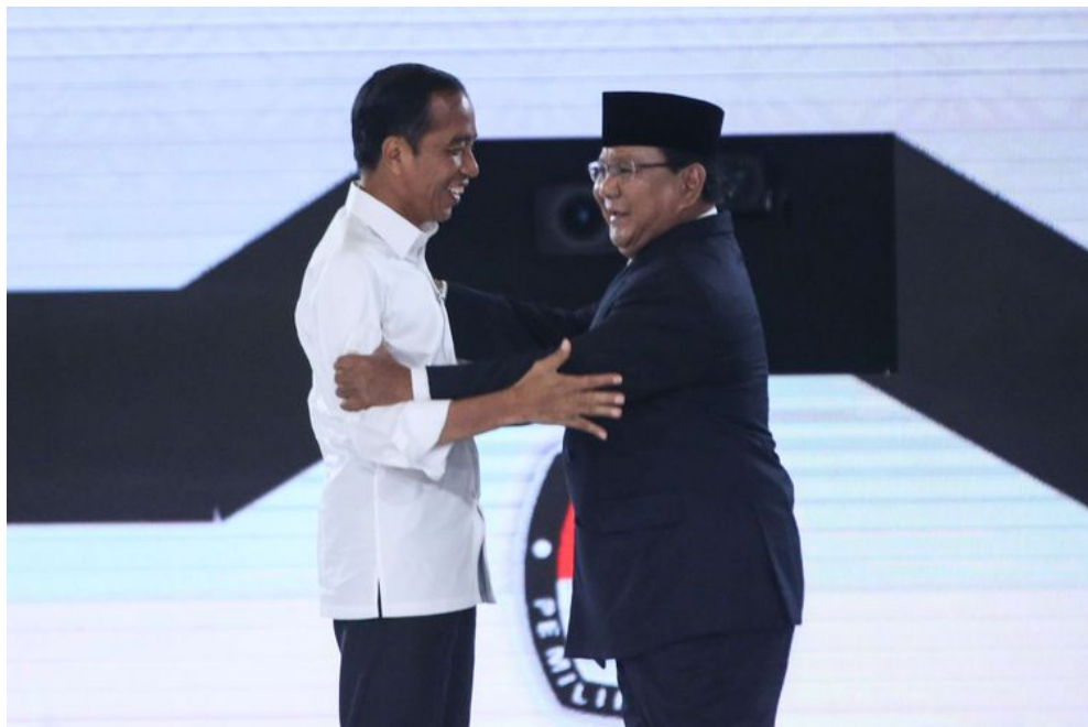
Calon presiden no urut 01 Joko Widodo (kiri) dan Calon presiden no urut 02 Prabowo Subianto pada Debat Keempat Calon Presiden Pemilu 2019 di Jakarta, Sabtu (30/3/2019). Debat malam ini mengambil tema ideologi, pemerintahan, pertahanan dan keamanan, serta hubungan internasional.