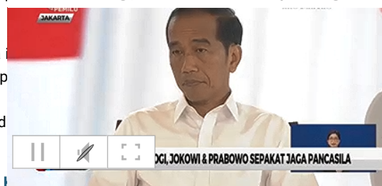
Bahas Ideologi, Jokowi dan Prabowo Sepakat Jaga Pancasila