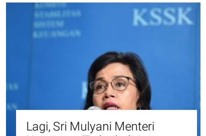
Lagi, Sri Mulyani Menteri Keuangan Terbaik di Asia Pasifik