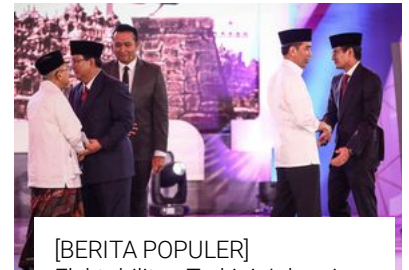
[BERITA POPULER] Elektabilitas Terkini Jokowi-Ma'ruf dan Prabowo-Sandiaga Versi 7 Lembaga Survei

Ikuti perkembangan berita ini dalam topik: