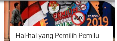
Hal-hal yang Pemilih Pemilu 2019 Wajib Tahu